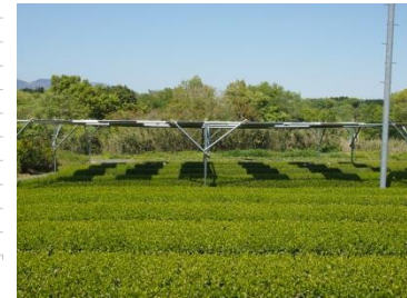
図 1 模擬棚下の光環境日推移 写真 模擬パネルの設置状況