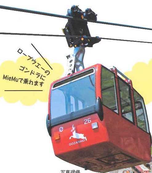
ロープウエーのゴンドラに MieMuで乗れます