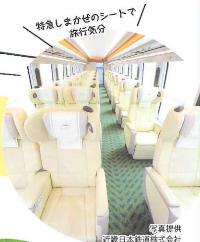
特急しまかぜのシートで旅行気分