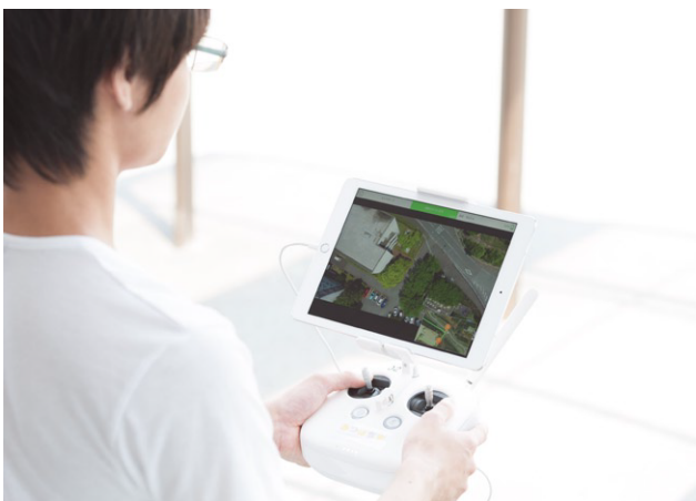
地域の防災減災に役立てるため、誰でも簡単にドローンの操縦ができるシステムを開発しました。

まさに伊勢志摩は、地域の課題解決を実証する最適の地です。学生のみんなには、これからも地域の課題と向き合い、将来的には地元で事業を興し、魅力ある伊勢志摩・三重県を築いてほしいと考えています。私は、そんな人材を育てていきたいと思っています。