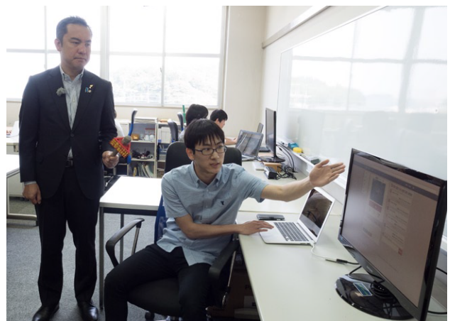
限られた人員で獣害対策が行える「まるみえホカクン」。完全自動で動物を捕獲できます。