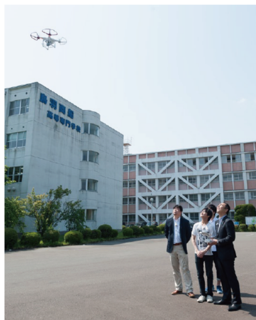
ドローンの操作を体験させてもらいました。

江崎: ずばり、コミュニケーション能力です。コンピュータというと一人で黙々と作業するというイメージがありますが、開発はチームで進めるのでメンバーや私とのやり取りはもちろ