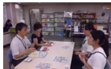
(おしごと広場みえへ訪問)

アスト津3階にある「若者就業サポートステーション・みえ」と「おしごと広場みえ」に行きました。津駅で、このような仕事をサポートしてくれる場所があることを初めて知りました。知らないことが多かったので私は勉強不足だと実感しました。社会へ出るにあたって、コミュニケーション能力が必要だと聞いたので、これからコミュニケーション能力を高めていきたいです。