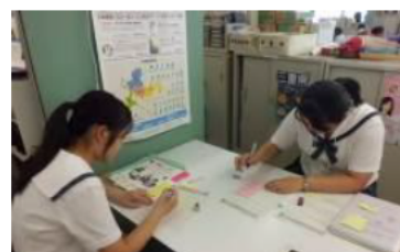
(レポート作成の様子)

「生き生きと働くために高校生に必要な就職支援」というテーマについて職場体験をしながらこの5日間考えました。実際に働いている方からお話を聞いたり、インターネットで調べたりしました。このテーマを調べている中で、就職してすぐに離職する人が多いことを知り、調べてみると知らなかったことが多くあって勉強になりました。また、現状や課題を知る事ができ、今ある問題について深く考えさせられました。1つ1つの情報を1枚の紙にまとめるのが難しかったです。またレポートを書く機会があれば、スムーズに書けるようになりたいです。