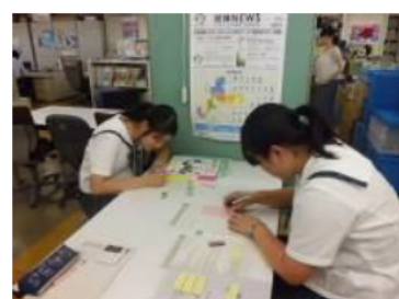
(レポート作成の様子)

レポートを作成したことがなかったので、自分の意見をまとめることが難しかったけれど、職員の皆様のサポートもあり、自分の考えを深めることが出来たと思います。