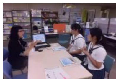
(サポステみえへ訪問)

「若者就業サポートステーション・みえ」や「おしごと広場みえ」を訪問しました。就職して働いていくためには学力も必要だけれど、それ以上にコミュニケーション能力が必要だということを教えてもらいました。