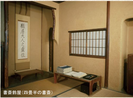
書斎鈴屋(四畳半の書斎)