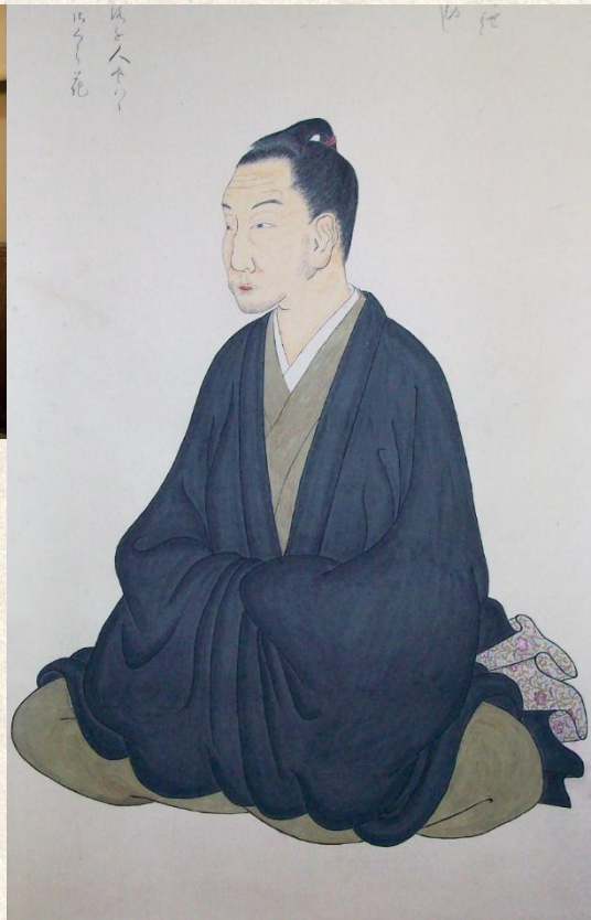
本居宣長六十一歳 自画自賛像