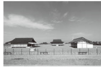
(さいくう平安の杜)

広々とした田園風景が広がり、豊かな海産にも恵まれている明和町は、天皇に代わり伊勢神宮の天照大神に仕えた未婚の皇族女性「齋王」が住んでいた「齋宮」があった町です。平成27年4月に「祈る皇女齋王のみやこ 齋宮」が