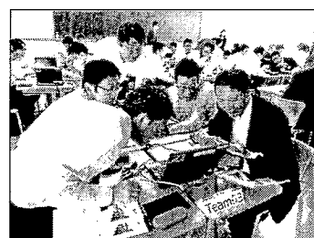
実機を用いた訓練の状況 (トレンドマイクロ社の協力により実施【H28.5】)