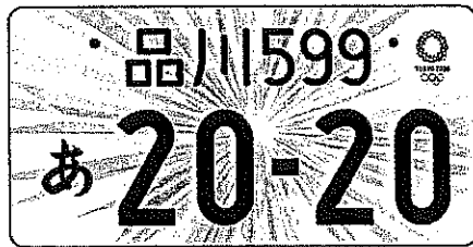
図柄入りナンバー(寄付金付き)