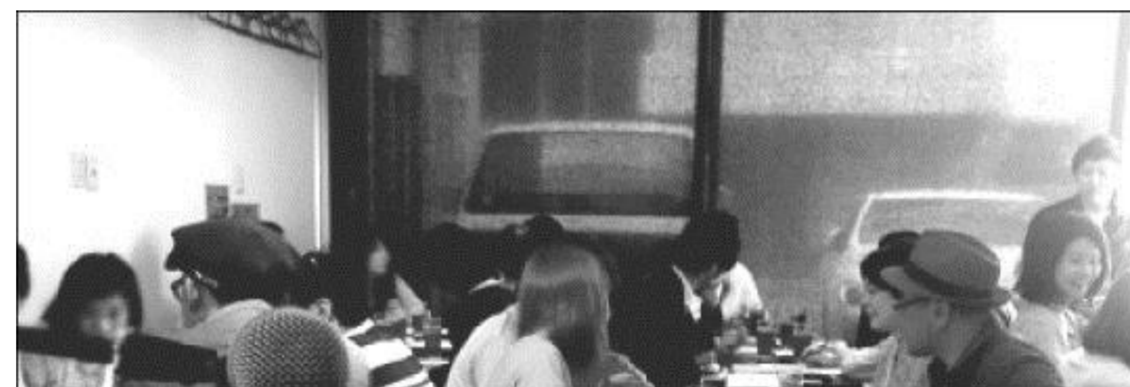
OTONAMIE x TOKYO