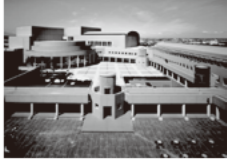
↑三重県総合文化センター外観 三重県文化会館小ホール内観↓

1994年、複合文化施設「三重県総合文化センター」の中にオープンした県立劇場。2004年10月から財団法人三重県文化振興事業団が指定管理者として運営。2011年7月より公益財団法人に。音楽・演劇・ダンス・伝統芸能など、様々な公演の開催を通じ、三重県の芸術文化の振興を担う劇場として活動。近年、演劇分野においては、官と民、地域といった壁を飛び越え、全国の劇場や劇団、演劇人とのネットワーク構築を開始。地元の演劇活性化はもちろん、各地と連携しての若手演劇人の育成、劇場の24時間連続使用による稽古場環境の整備、若手注目劇団をセレクトして三重に紹介するMゲキ!!!! セレクションの創設、など、常に柔軟な姿勢で、様々な手法を模索している。