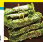
宮城/しそ巻くるみ揚

宮城・三重・広島3県飲み比べセット 1,400円 (税込) 3県のメニューの中から、 地酒3杯+おつまみ3品が選べる、お得なセットです。