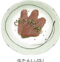
牛たんいぶり スモークスライス