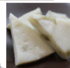
三重/あおさはんぺん