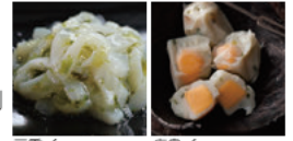
三重/コリコリいかアオサ抹茶ジュレ和え 広島/さざれ石

三重県の地酒1杯と肴3品の味比べセット 1,300円 (税込) 伊勢慶酒 おかげさま+おつまみ3品「コリコリいかアオサ抹茶ジュレ和え」「伊勢たくあん」「ノマカツオの塩切り」 広島県の地酒1杯と肴3品の味比べセット 1,300円 (税込) 純米吟醸 幻 +おつまみ3品「がんす」「鳥皮みそ煮」「さざれ石」 また、宮城県の地酒1杯と肴3品の味比べセットとして、 左記写真のセットメニューを、 1,300円 (税込)でご提供します。