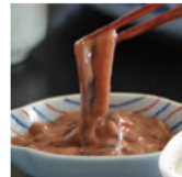
宮城/昔ながらの濃厚熟成塩辛

広島セット 900円 (税込) 純米吟醸 幻 +おつまみ2品「安藝紫」「子持ちこんにゃく」