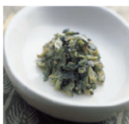
広島菜漬 倭(やまと)