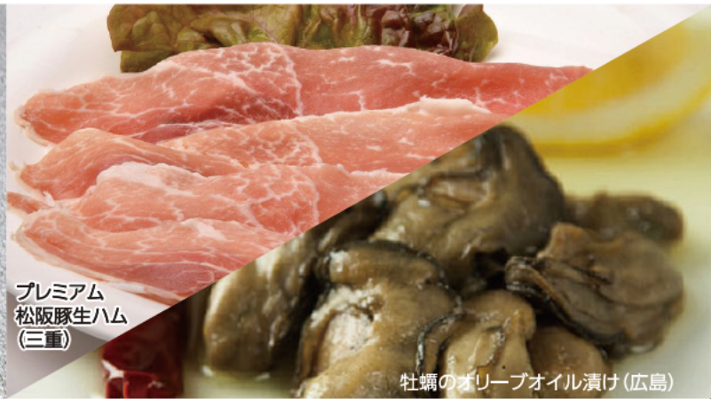
プレミアム 松阪豚生ハム (三重)