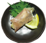
焼き牡蠣生ハム巻き