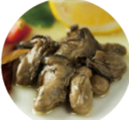
牡蠣のオイルオイル漬