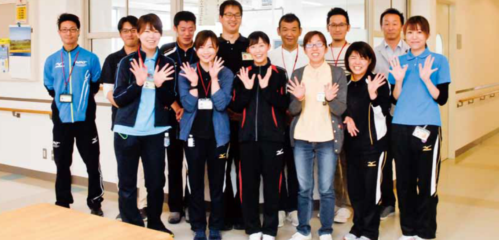
文／地域生活支援部 作業療法士 矢崎太郎

「アルコール」をご用意しています。目標や目的に合った3つのコース「精神一般」、「リハビリ（復職・就労支援）」、