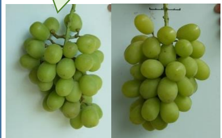
収穫時における果房型の比較 (左：省力果房管理区 右：慣行管理区)