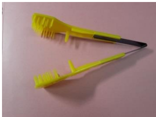
花蕾除去器具 (商品名：テキライグシ)