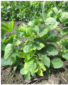
図1 2014年にいなべ市で発生した大豆の矮化症状