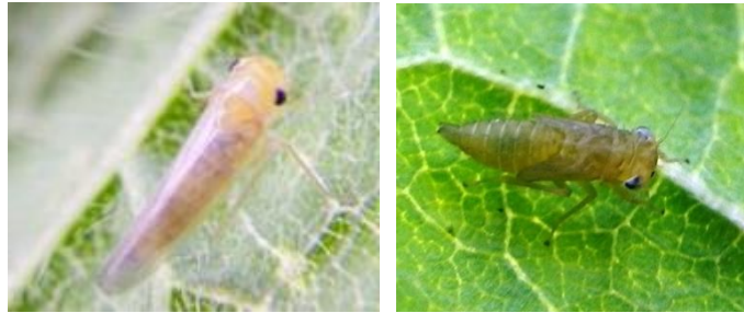
図2 カンキツヒメヨコバイ Apheliona ferruginea の成虫(左)と幼虫(右) 成虫の体長は4mm内外