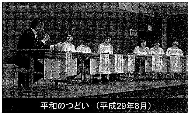
平和のつどい (平成29年8月)

伊勢志摩サミットの成果を生かし、被爆地広島との交流などを通じて、被爆・戦争関係資料を展示するとともに県内の若い世代を中心とした参加者が被爆・戦争体験者と意見交換できるような機会を設けます。