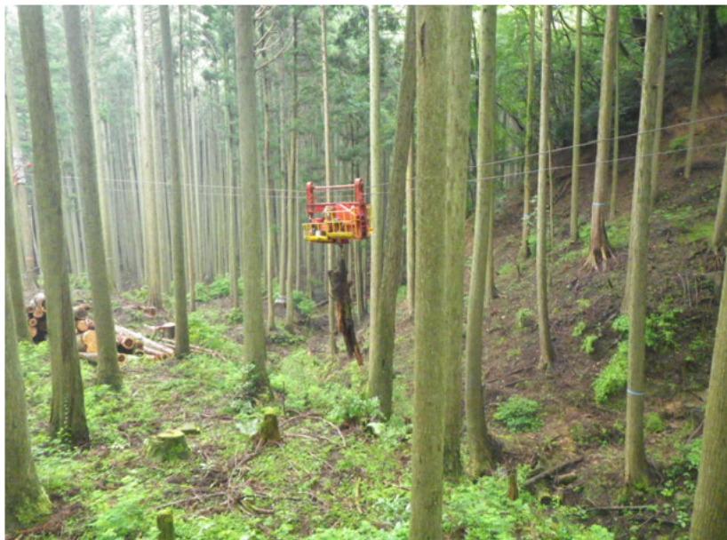
ケーブルクレーン集材状況