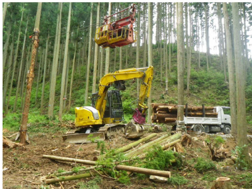
ケーブルクレーン集材状況