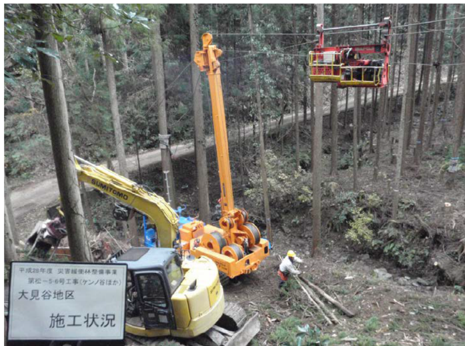
タワーヤーダ集材状況