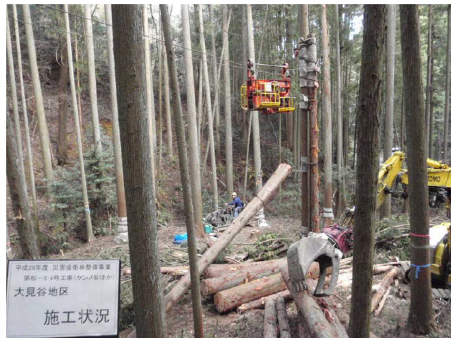
ケーブルクレーン集材状況