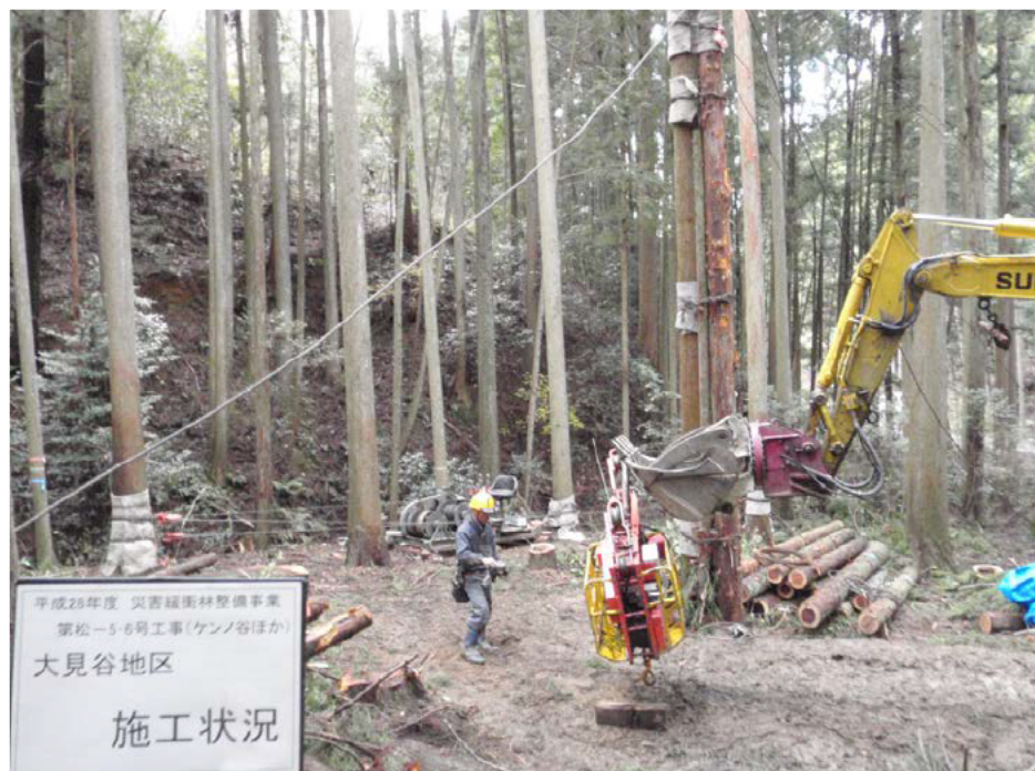
ケーブルクレーン仮設状況