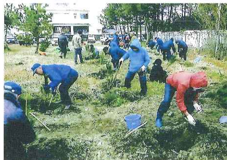
緑の募金交付事業 伊勢市東大淀町会