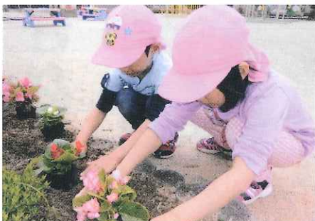
春期緑化運動 志摩市甲賀保育所