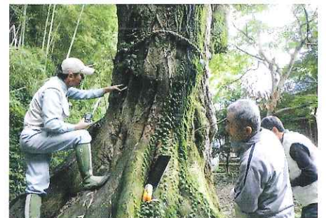
樹木健康診断 四日市市大樹寺スタジオ