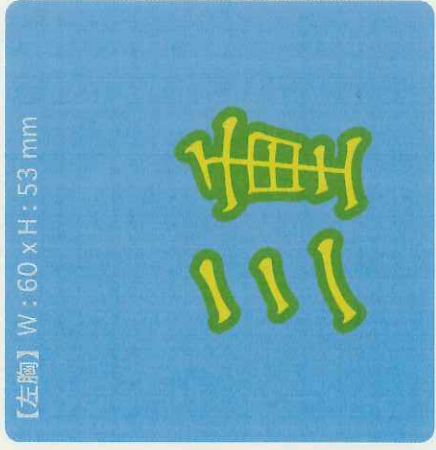
【左胸】 W: 60 x H: 53 mm