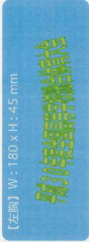
【左胸】 W: 180 x H: 45 mm