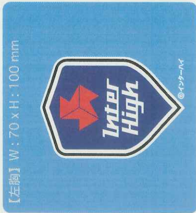
【左胸】 W: 70 x H: 100 mm