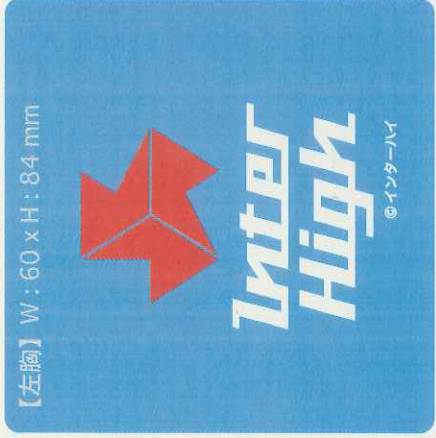
【左胸】 W: 60 x H: 84 mm