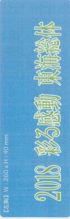
【左胸】 W: 260 x H: 40 mm