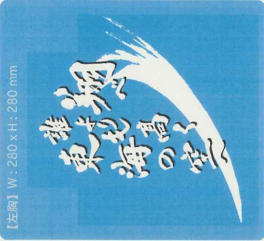
【左胸】 W: 280 x H: 280 mm