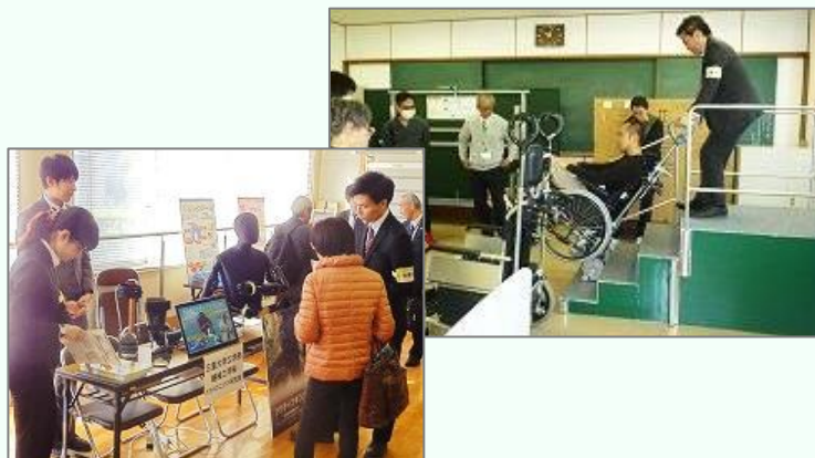
図1 県内出展者 ※【 】内は主な展示品

出展者からは「介護専門職の方の意見を聞くことができ有意義だった」「生の現場の声が聞けた」などの感想があり、出展者同士が交流する場面も多く見られました。