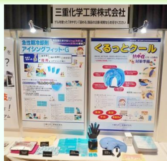
出展ブースの様子