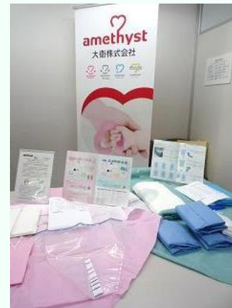
経膈分娩用キット/帝王切開用キット