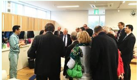
ミルボンにて開発工程の説明を受けるミッション団