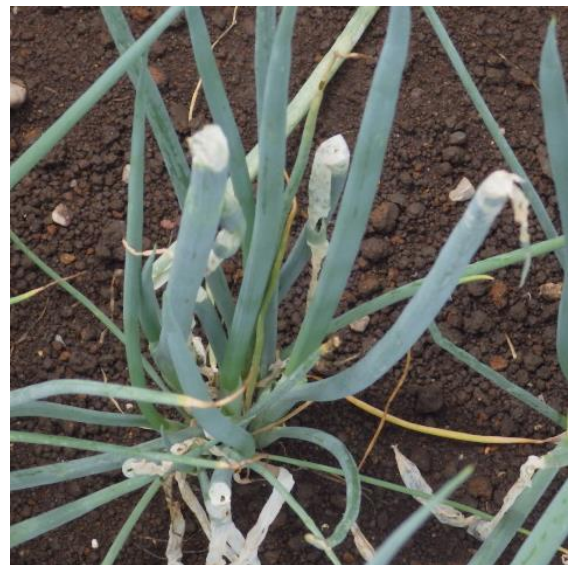
(図2) ネギでの被害状況