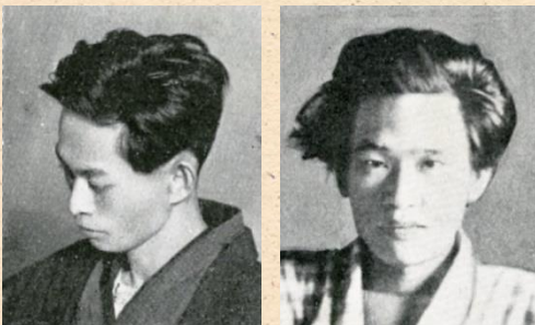
30歳代の川端康成と横光利一 『文芸年鑑1932版』改造社より