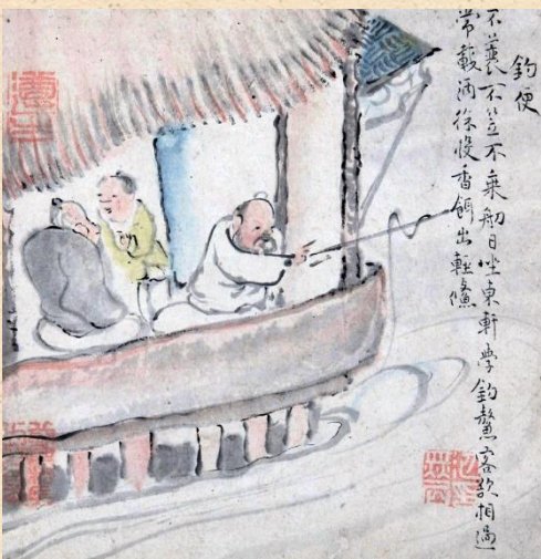
池大雅《十便図》国宝1771年 公益財団法人川端康成記念会蔵

川端康成(かわばた・やすなり1899-1972)と横光利一(よこみつ・りいち1898-1947)。「伊豆の踊子」「雪国」など日本人初のノーベル文学賞作家『川端康成』と、伊賀で青少年時代を過ごし「文学の神様」とまで呼ばれた三重ゆかりの文豪『横光利一』の2人はともに、1920年代初めに文壇にデビューし、大正から昭和の時代まで日本の文学を推し進め、生涯の親友でもありました。