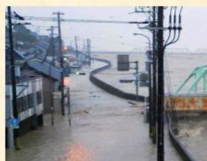
熊野川の氾濫（平成23年8月 紀宝町）