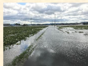
農地の浸水被害（平成29年10月 松阪市）