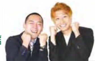
トラッシュスター