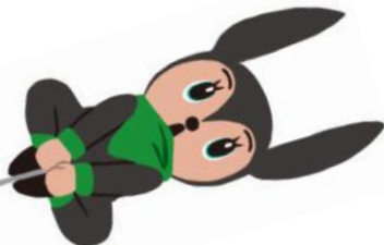
三重県応援キャラクター