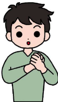
なかも 仲間・友だち