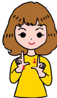
ら い ん LINE