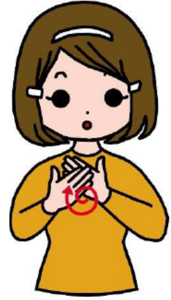
お だ じ 肩に