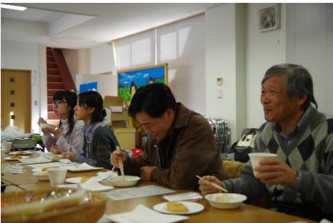
つきたてのお餅で昼食