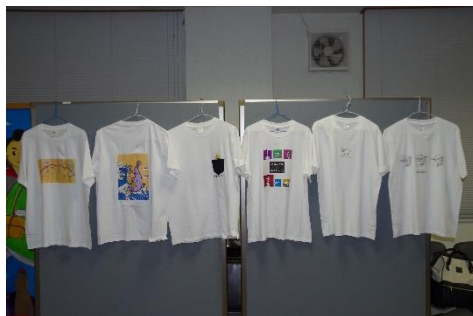
オリジナルTシャツづくり