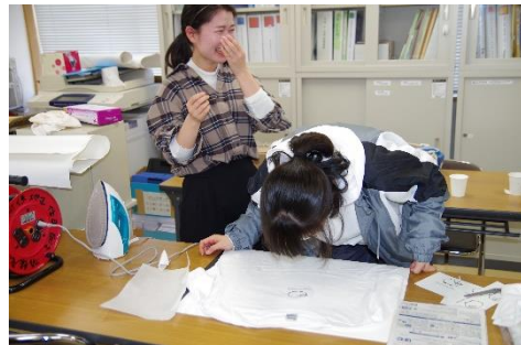
オリジナルTシャツづくり