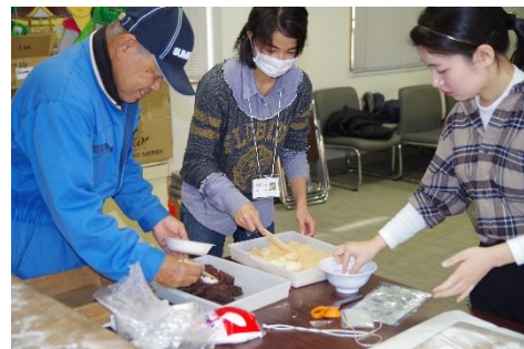
餅つき (きな粉、あんこ)