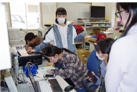
オリジナルTシャツづくり