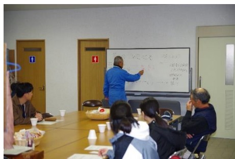
講話（防災ボランティア活動）

その後、来年 3 月の初瀬街道まつりに向けて、同まつりで使用するグッズの一つとして参加者それぞれのオリジナル T シャツを完成させるとともに、初瀬街道まつりの PR や、まつりでのブース出展などについて学生同士で意見を出しあった。