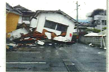
倒壊して道路をふさぐ建築物(熊本地震)