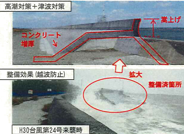
【宇治山田港海岸（二見地区）】