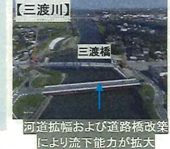
河道拡幅および道路橋改築により流下能力が拡大