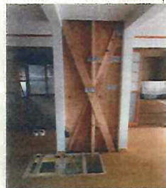
筋かいによる耐震改修の事例 (補強壁内部の状況)