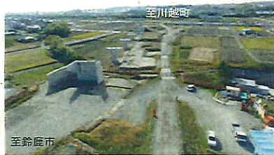
整備が進められている国道1号北勢バイパス

地域の経済活動や国内外からの集客・交流等を支える基盤となる高規格幹線道路および直轄国道の整備促進を図るとともに、未事業化区間の早期事業化に向けた取組を進めます。