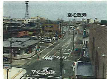
平成31年度完成予定の(都)松阪公園大口線

自然災害時に道路機能を確保する必要がある施設について、のり面・盛土等の防災対策、冠水対策、橋梁耐震対策等を集中的に進めます。