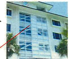
ホテルの耐震改修の事例