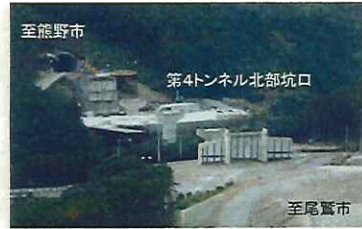
早期完成に向けて工事の最盛期を迎える熊野尾鷲道路(Ⅱ期)