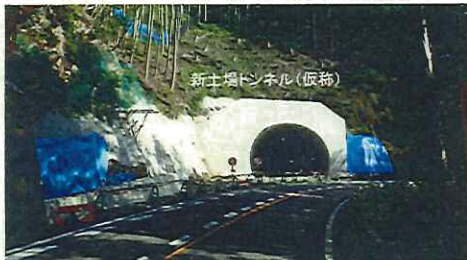
平成31年度完成予定の国道169号土場バイパス

高規格幹線道路等へのアクセス道路やバイパス等の抜本的な整備に加え、柔軟な対応を織り交ぜながら、県管理道路の整備を推進します。