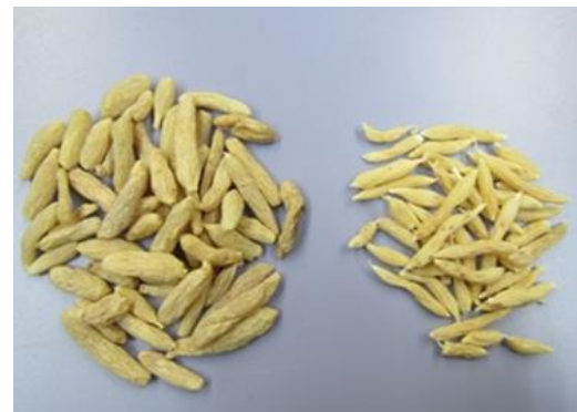
ジャノヒゲのバクモンドウ (中国産) (国産)