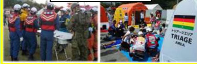
現地合同調整所設置運営訓練 応急救護所設置運営訓練