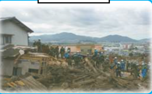
土砂崩落救助訓練