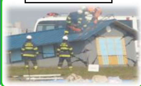
倒壊建物救助訓練