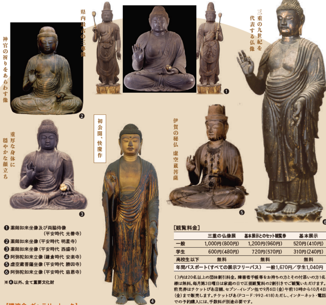
神官の祈りをあらわす像

平安・鎌倉期の仏像を中心に、本尊、秘仏を含む三重の仏像を一堂に会し、その魅力を様々な角度から紹介します。新発見の快慶作 阿弥陀如来と地藏菩薩も初公開します。