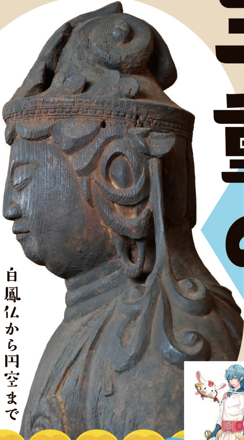
重要文化財 普賢菩薩坐像 (平安時代 普賢寺)