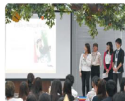
最終プレゼンテーション会の様子