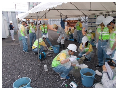
裏込材の供試体作成体験の様子