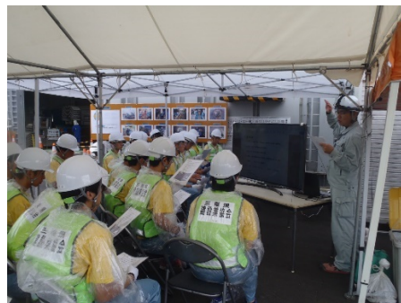
現場責任者からの説明