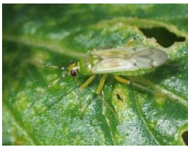
タバコカスミカメ