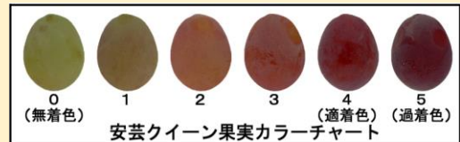
「安芸クイーン」専用果実カラーチャート