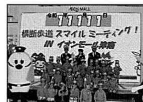
横断歩道スマイルミーティング