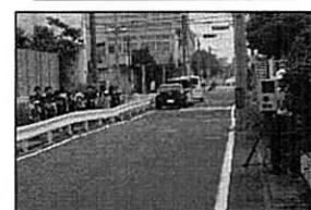
移動オービスによる取締り