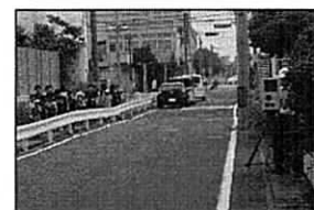
移動オービスによる取締り