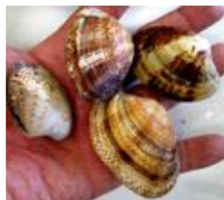
親貝の減少が問題となっている

三重県におけるアサリの年間水揚量は、ピーク時の1万5千トンから2千トン前後に激減しています。その原因としては、生息環境の悪化のほか、親貝の乱獲が指摘されています。