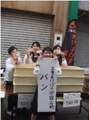
製菓調理 SBP 交流フェア