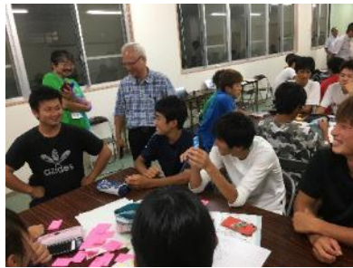
答志島サスティナブルキャンプ