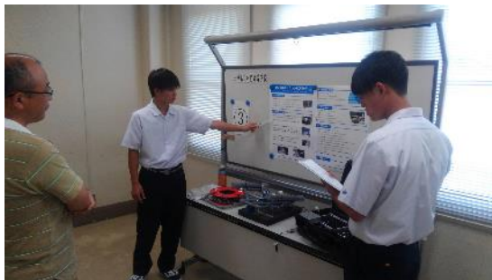
全国マリンロボットコンテストでの発表

水産高校の専門性を活かし、3年生の「課題研究」において地域の題材や課題解決に向けて学習活動を進めています。水産資源科においては地元企業と協働し、伊勢マグロの廃棄部位の有効活用の研究を進めました。海洋・機関科では、地元海女さんへの聞き取りから、海女さんが漁で使用する「磯ノミ」を作成・改良するとともに、マリンロボット（水中ドローン）の研究をすすめ全国コンテストでも準優勝となりました。