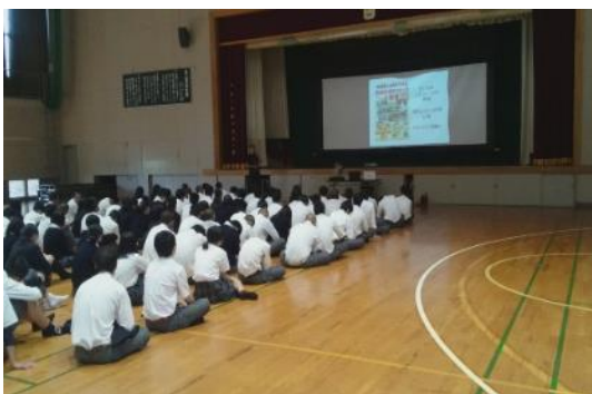
地元企業経営者の講演

2年生就職希望者全員が伝統的に取り組んできたインターンシップの際に、事前の企業調べや事後研修に主体的に取り組むことで、年間を通じた継続的な学びへ改善されました。お世話になった企業の紹介動画づくりに取り組むことで、企業の魅力やあり方について考察を深めるとともに、地域での成果発表会に向けたプレゼン演習を通じて、表現力やコミュニケーション力を育成しています。