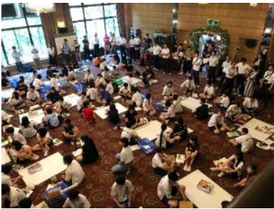
全国高校小規模校サミット