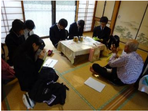
1年フィールドワーク

1年生全員が「総合的な探究の時間」において、志摩市職員からレクチャーを受け地域の現状と課題、魅力について学んだのち、興味関心がある課題についてグループでテーマを設定し、フィールドワーク等を通じてその現状を体感し、解決策について話し合う活動を行っています。また、2年生ではさらにインターンシップを実施して地域や地域の産業について研究を進めています。