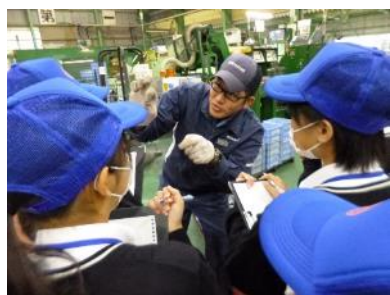
2年生看板プロジェクト