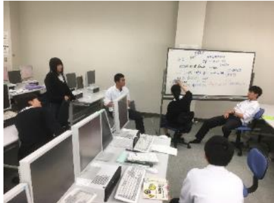
3年生いいなんゼミ