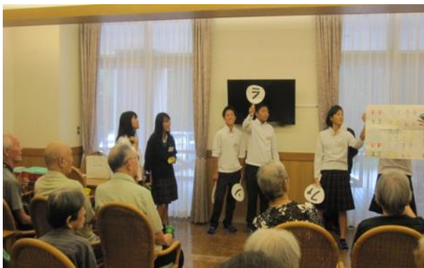
ケアハウス彩光 交流