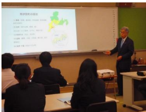
外部講師による講演（南伊勢町長）

1年生は「総合的な探究の時間」、2年生は「地域探求」や「インターンシップ」、3年生では「地域課題研究」の科目を開設して、町長から町の課題について直接話を聞くなど数多くの講演会や地域の事業者によるワークショップ、それらの事業者の仕事場でのフィールドワーク、インターンシップの実施など、地域と密着した探究活動を実践しています。