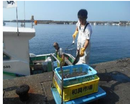
2年インターンシップ