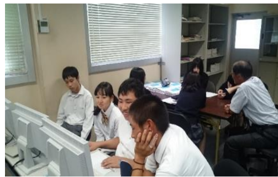
発表会に向けてのワークショップ