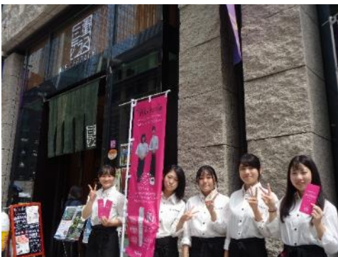
美容服飾 東京研修①（三重テラス）