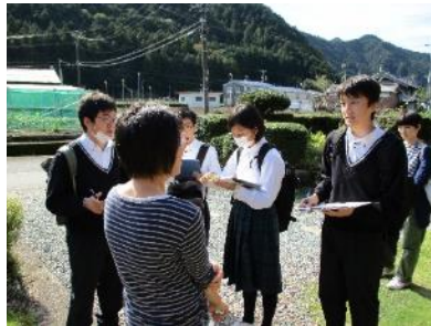
1年生フィールドワーク②