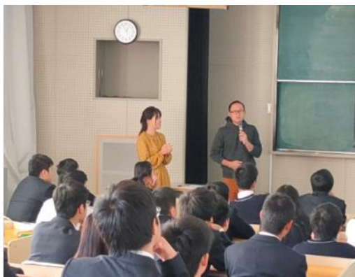
地域の職業人による講話（県外からの移住者）

1、2年生全員が町役場の職員から講義を受け、地域の現状や課題について学習し、2年生では地域の保育所や特別支援学校、地域との交流学习やケアハウス、森林組合等での体験活動を行っています。また、南勢校舎との遠隔授業の試行を行い、小規模校においても必要な科目を受講できるとともに多様な意見に触れることができるよう研究を進めています。