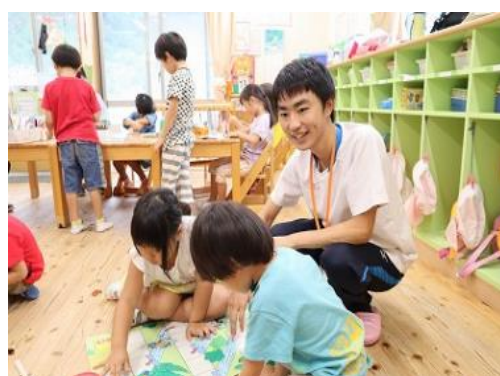
保育園でのインターンシップ