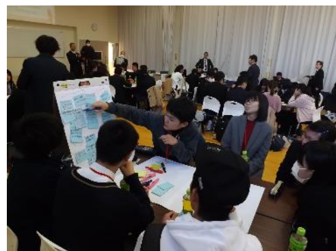
昨年度サミットの様子