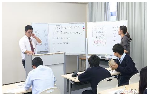
鳥羽市職員による講義