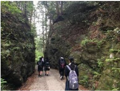
1年生フィールドワーク①

ベンチマーキング等……山形県立小国高等学校、愛媛県立三崎高等学校、東北芸術工科大学での研修