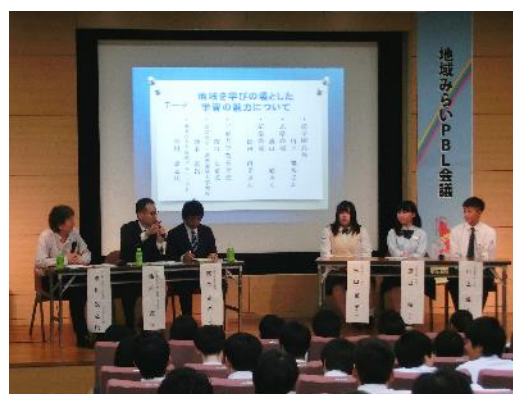
パネルディスカッション