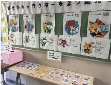
2年生イメージキャラクター作成