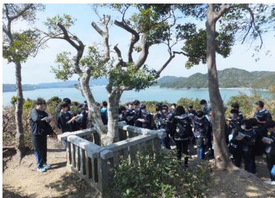
1年生フィールドワーク（答志島）

また、2年生は学校設定科目である「鳥羽学」において、鳥羽市の協力を得ながら、生徒が鳥羽の魅力や課題を理解するとともに、その魅力の発信や課題の解決に取り組んでいます。海女文化を発信するため、複数の企業と連携したVR（バーチャル・リアリティー）の体験映像の制作や商店街でのフィールドワーク、インタビュー等を通じて中心市街地の活性化について考えるなど魅力発信等に取り組んでいます。