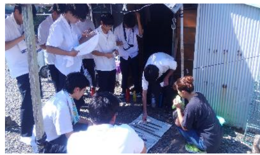
地元海女さんとの意見交換