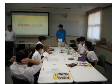
神島高校との交流②