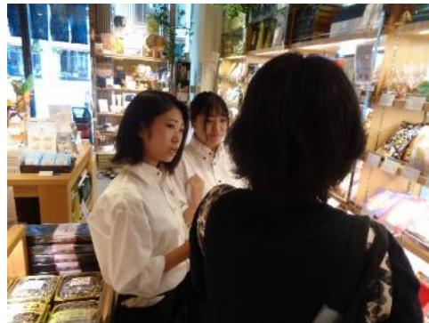
東京研修②（三重テラス）

地域学習や他校との交流の取り組み等が比較的短期間に集中していたため、生徒は連続的に達成感を感じたようです。今までの「やらされている」から「私たちがやっている」という主体的な考え方に変わっていく生徒たちの様子が見ることができた。さらに、最近「私ならこうしたい」と前向きに考えることができるようになっている。