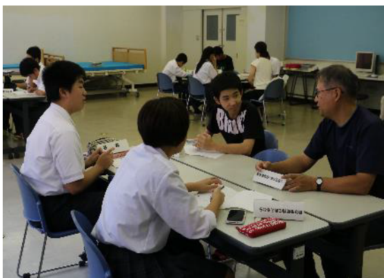
地元の大人との出会い

1年生全員が「産業社会と人間」で地元企業の見学や地域の語り手からの講演等を通じて地域学習の基礎を学び、2年生以降の総合学科の各系列（国際交流・スポーツ・美術工芸・生活福祉・環境技術）において地域を題材とした発展的な学習につなげます。国際交流系列では、地域の課題解決策をグループで協議する「まちかつ」、環境技術系列では山林活動や林産物利用を考える学習、生活福祉系列では介護の諸問題を体験から学ぶ取組などを実施しています。