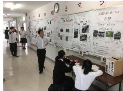
校内での魅力マップ展示