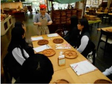
1年FW（モクモク手作りファーム）