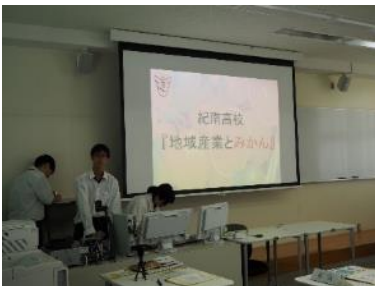
神島高校との交流①