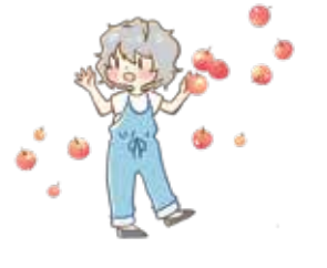
イラスト:まつもとちひろ

わたしたち一人ひとりが「部落差別は許されない」ことを理解し、部落差別のない社会をつくりましょう。