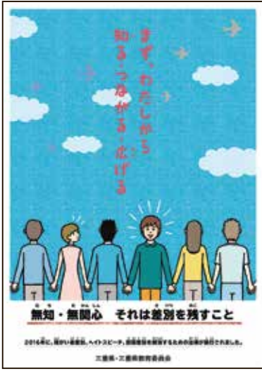
令和元年度人権啓発ポスター