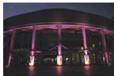
三重県総合文化センター