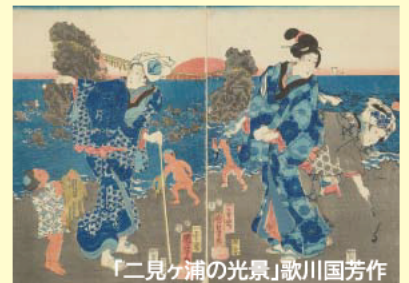
「二見ヶ浦の光景」歌川国芳作

今も昔も旅の楽しみの一つ、名所めぐりの 魅力を、浮世絵をはじめとする名所絵を 通して紹介します。