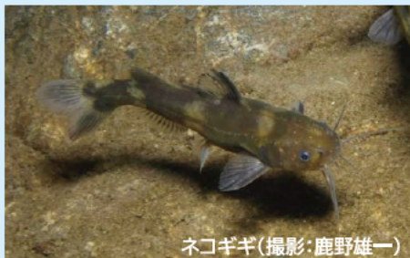
ネコギギ