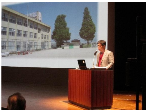
四日市市立下野小学校