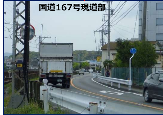
幅員が狭く走行性が悪い区間