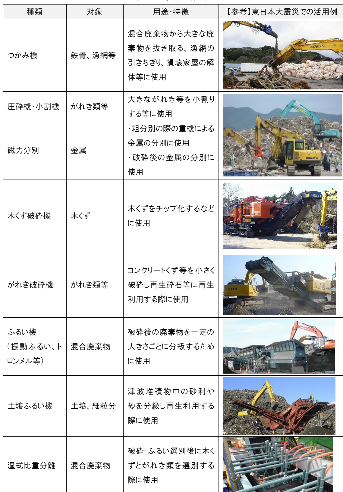
表 破碎選別機の例