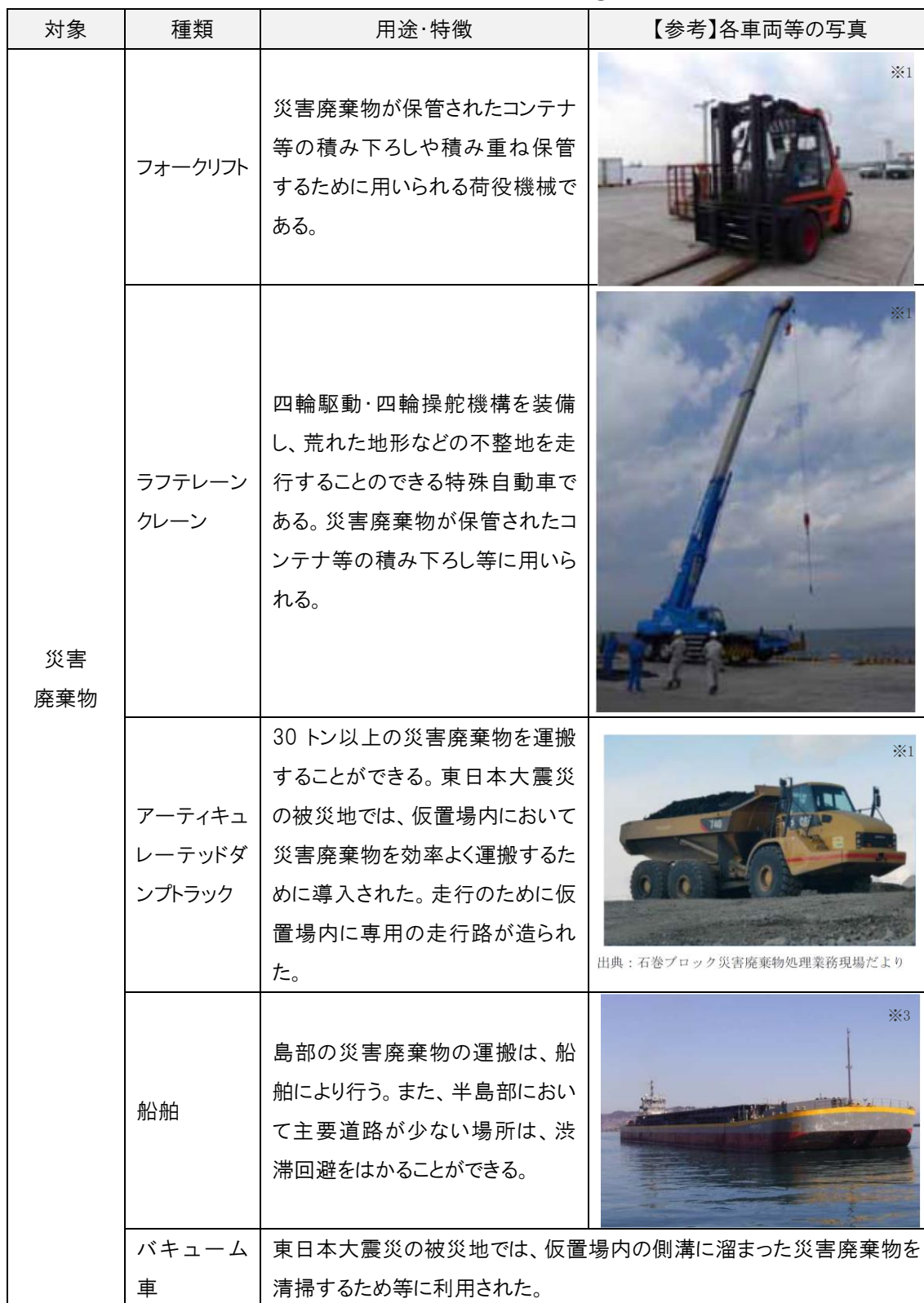
表 収集運搬車輛等の例②