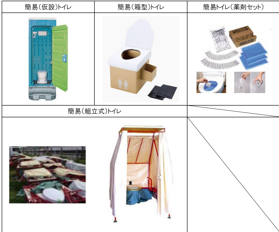
表 災害用トイレの種類