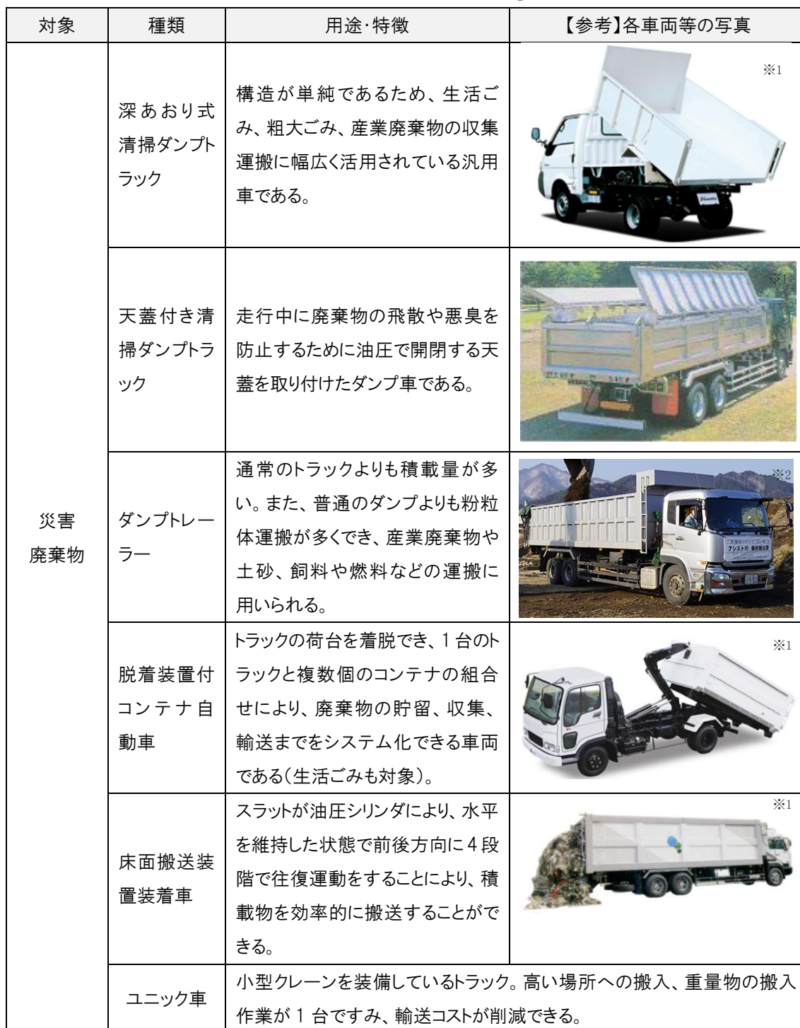
表 収集運搬車輛等の例①