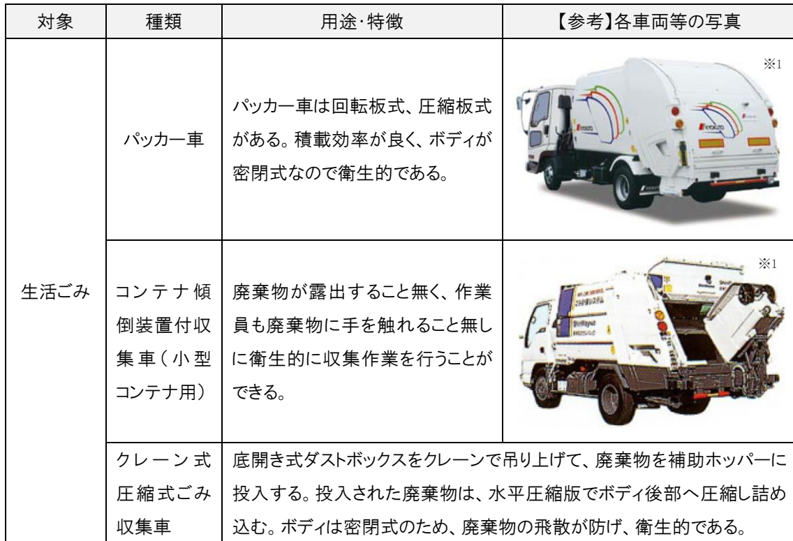
表 収集運搬車輛等の例③