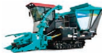
汎用型微細断飼料収穫機 (株式会社タカキタHPより引用)

極短穂で長稈の高糖分高消化性WCS用稲を効率的に収穫するため、県内でも「回転式フォレージャーベスタ」が導入されている。この機械は従来の機械よりも短い切断長(1cm程度)で収穫できるため、圃場で収穫した稲をバラで飼料基地に運搬し、そこで細断型ロールベアラで梱包する体系がとれ、収穫調製作業効率が向上し、極めて良質な稲WCSが調製できる。長稈稲を短く切断収穫する収穫機は他にも市販されている(右図は一例)。