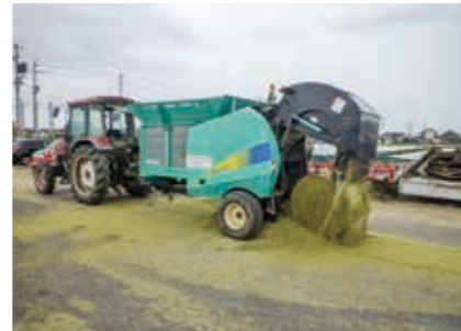
細断型ロールベアラ

このリーフレットは、農林水産省委託プロジェクト研究「収益力向上のための研究開発」(自給飼料分科会)により行われた研究の成果を基に作成しました。