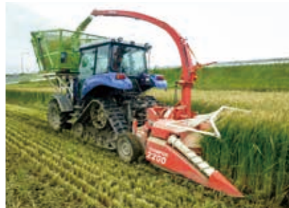
回転ドラム式フォレージャーベスタ