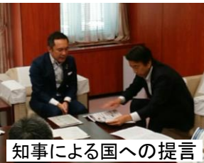
知事による国への提言