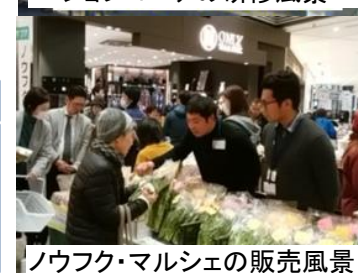
ノウフク・マルシェの販売風景