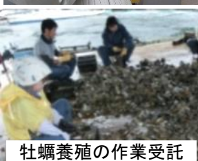
牡蠣養殖の作業受託