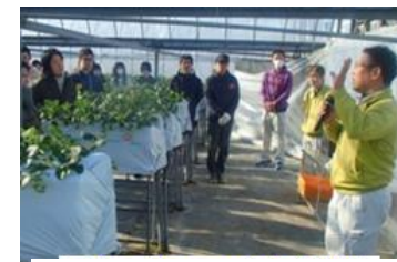
ジョブコーチの研修風景