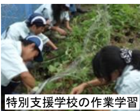
特別支援学校の作業学習