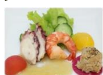
機内食に採用されたノウフク商品