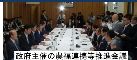
政府主催の農福連携等推進会議