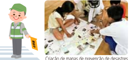
Criação de mapas de prevenção de desastres