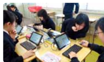
Aulas que utilizam TIC