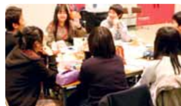
Atividades interativas de aprendizado