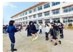
Uma escola, um exercício físico (Pula corda comprida)