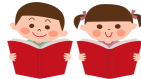
Imagem futura Fazer com as crianças formem a "capacidade acadêmica estável", como conhecimentos e habilidades, capacidades de pensar, julgar, e expressar, etc, "coração rico", como um coração que valoriza a vida e tem consideração pelos outros, "corpo saudável", como saúde mental e física, força física, etc, reconhecendo seus próprios lados positivos, e obtendo a capacidade necessária para desafiar as possibilidades, com sonhos e aspirações, sem medo de fracassar.