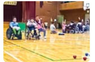
Campeonato de Boccia em escolas de apoio especial