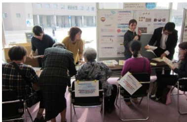
学生による減塩啓発