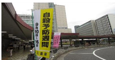
自殺予防週間街頭啓発