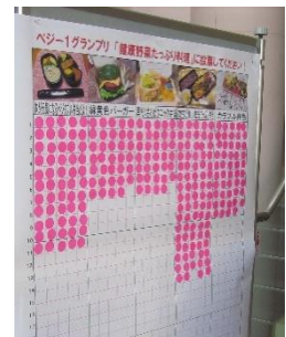
参加者による投票