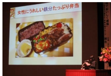
高校生によるプレゼンテーション